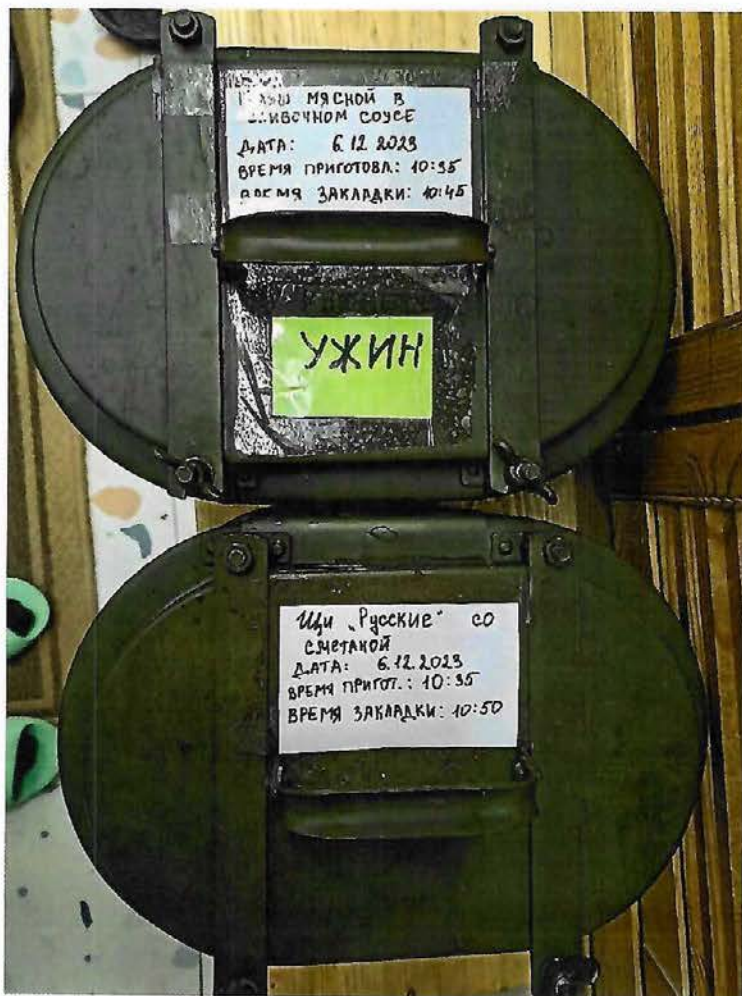
Фото к п.5